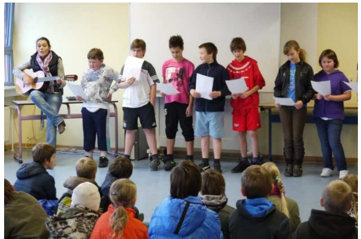
Musikalische Begrüßung durch die 6c