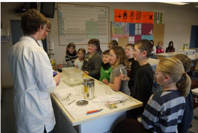
Spannende Experimente im Chemieunterricht