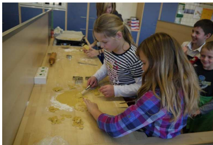
Plätzchen backen in der Schulküche